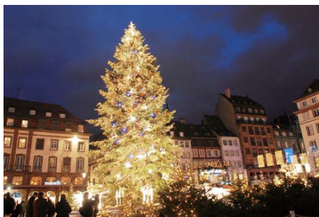
アルザスのクリスマスツリー