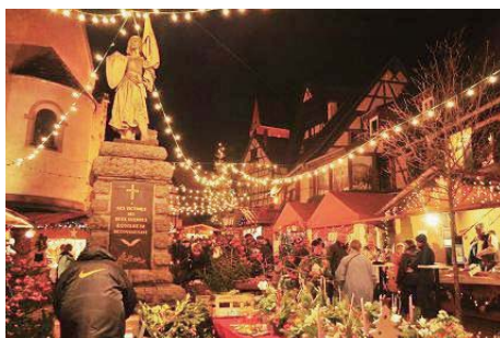
クリスマスマーケット