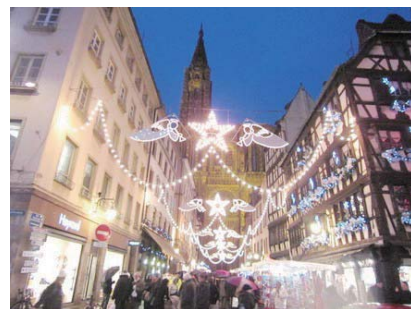
クリスマスで華やかな街並み