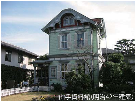
山手資料館(明治42年建築)