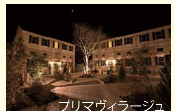
プリマヴィラージュ