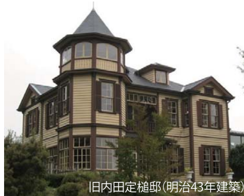
旧内田定槌邸(明治43年建築)

山手のように、官民一体となって美しい街並みを守り続ける街が日本中にたくさんできると良いですね!