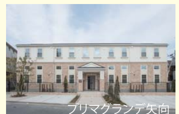
プリマグランデ矢向

また、右の写真「プリマグランデ矢向(横浜市)」「プリマヴィラージュ壱・弐・参番館(飯能市)」も完成。アパートの新築・建替えをご検討の際には、必ず見ないと損する物件です。完全予約制となっておりますので、お問い合わせくださいませ。