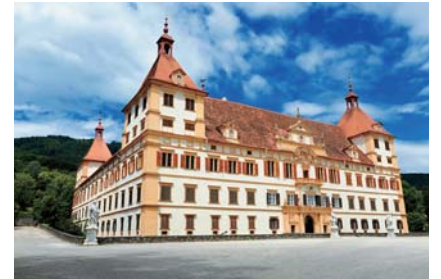
エッゲンベルク城

旧市街地は、中世から幾世紀にも渡り形成されたので、ゴシックからルネサンス、バロック様式が混在する街並みになっております。それにも関わらず、 一つの街並みになっているのは、一つ一つの建物がデザイン性に特化し、こだわり抜かれた建物ばかりだからではないでしょうか。